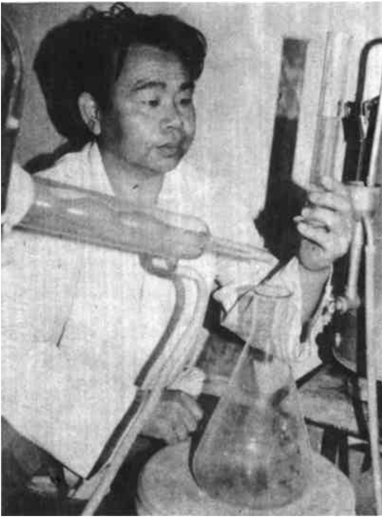
胡擦剂”及“保健面条”三项国家专利产品。其中“保健面条”已投入批量生产，“复方案胡擦剂”专利已有外商欲出50万元美金购买。

北农大动物科技公司 山东销售公司 为您提供各种兽药饲料 添加剂及技术服务 地址：东营市淄博路西 城宾馆114房间 电话：220088—3114 联系人：于先生 赵小姐